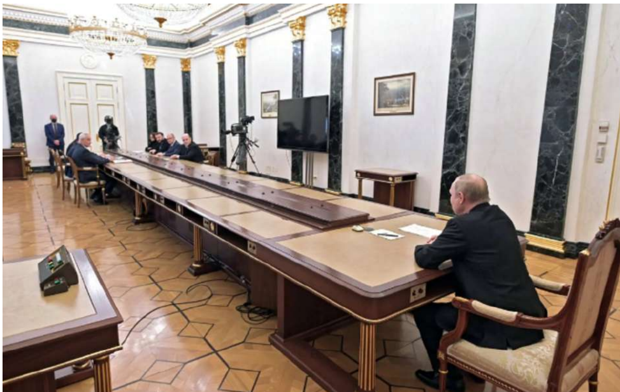
Wladimir Poetin heeft een ontmoeting met zijn top-adviseurs

Na de bezetting van De Krim door Rusland in 2014 sprak Angela Merkel, de toenmalige Duitse bondskanselier, met president Poetin. Ze vertelde vervolgens tegen president Obama dat Poetin volgens haar het zicht op de realiteit verloren had. Merkel vond dat Poetin “in een andere wereld” leefde. Deze benadering van fragmentering, isolement en scheiding wordt nergens duidelijker zichtbaar als in recente foto's van Poetin, helemaal alleen zittend aan het einde van een hele grote tafel. Zijn team (of soms ook een andere regeringsleider) zitten aan het andere uiteinde.