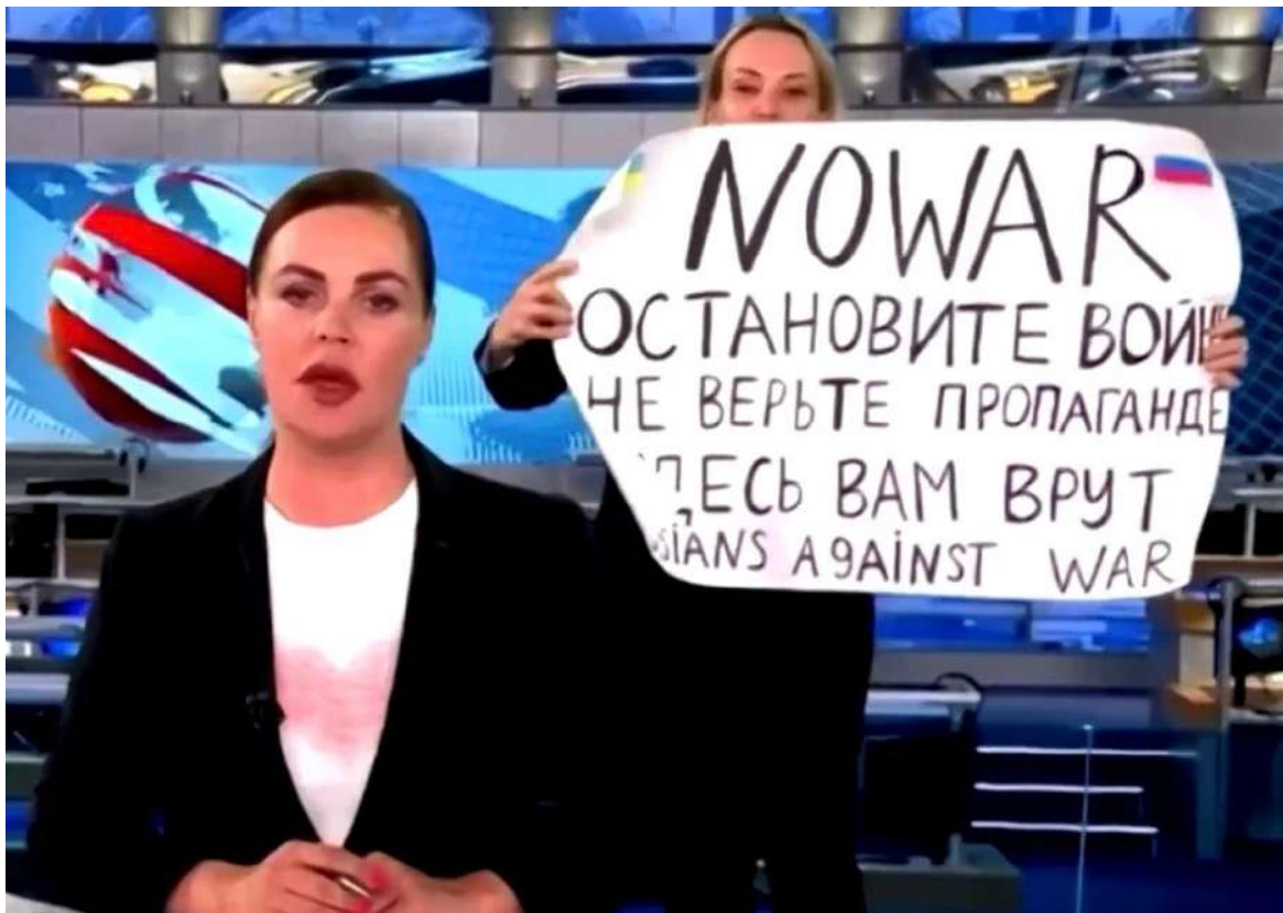
Op 14 maart protesteerde de Russische Marina Ovsyannikova op de televisie tegen de oorlog.

De tweede verrassing was de reactie in Rusland zelf. Ook daar heeft de burgerbevolking in meer dan 1000 steden geprotesteerd in de vorm van anti-oorlogsdemonstraties. Daarnaast ondertekenden 7000 Russische wetenschappers binnen enkele dagen na het begin van de invasie een open brief tegen deze oorlog. De zichtbare signalen van onenigheid hebben nog geen grote omvang bereikt, maar ze vormen een belangrijk begin van een beweging die zich mogelijk heel snel over heel Rusland kan uitbreiden. Ondanks de Russische propaganda, de vele arrestaties en onderdrukking.